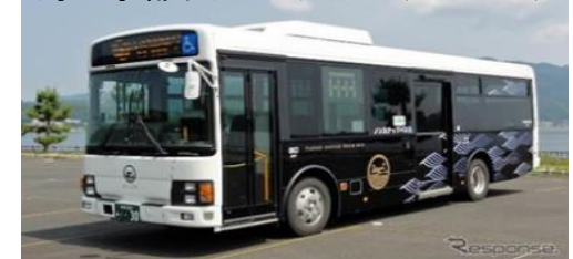
海の京都ラッピングバス(イメージ)