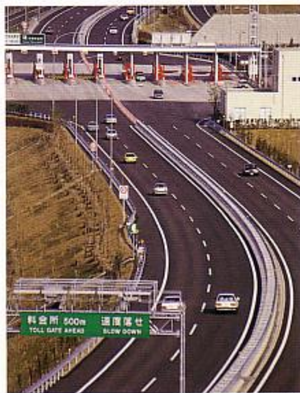
京都縦貫自動車道