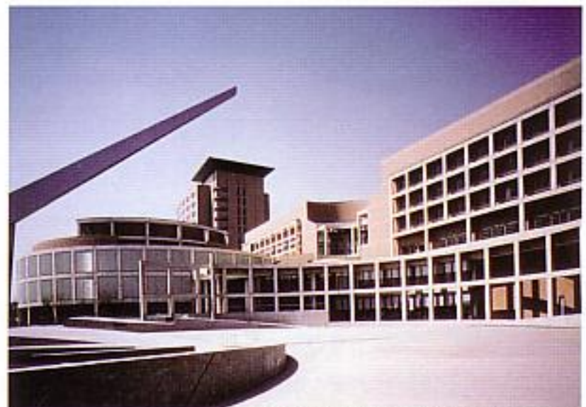
関西文化学術研究都市(けいはんなプラザ)