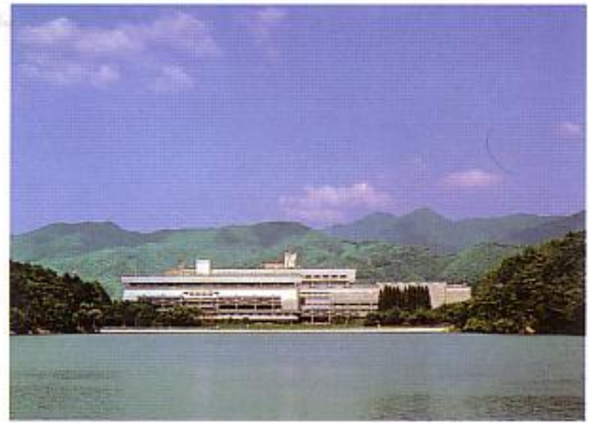
国立京都国際会館