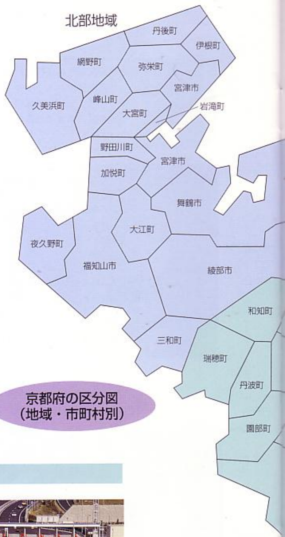
京都府の区分図 (地域・市町村別)