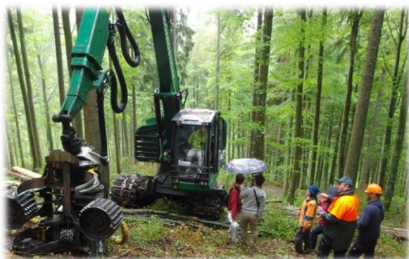
ドイツの高性能林業機械を見てきました。日本のものとの違いにびっくり！

ています。学生も様々な疑問が生まれたようで、たくさんの質問が飛び交いました。ドイツから、多くのことを学んだ研修となりました。