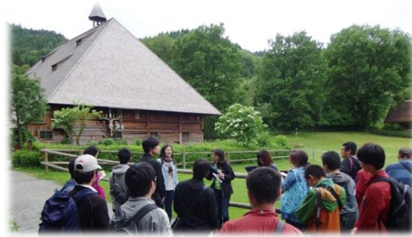
野外博物館には、ドイツ南西部の様々な場所の古民家が移築されています。ドイツの人の暮らしと森林との関わりを学ぶことが出来ました。