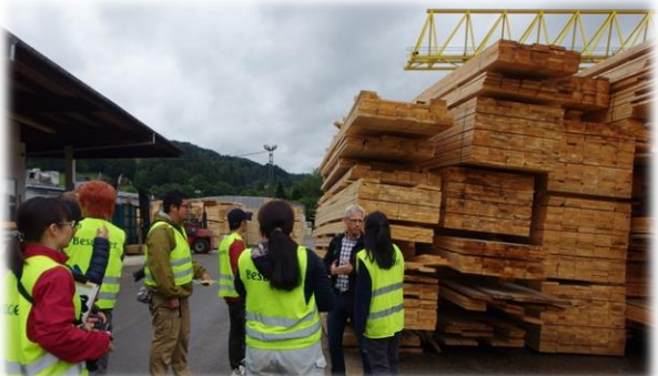
年間に10tトラックで11,000台分の丸太を加工している製材所。日本とのスケールの違いに驚きました。