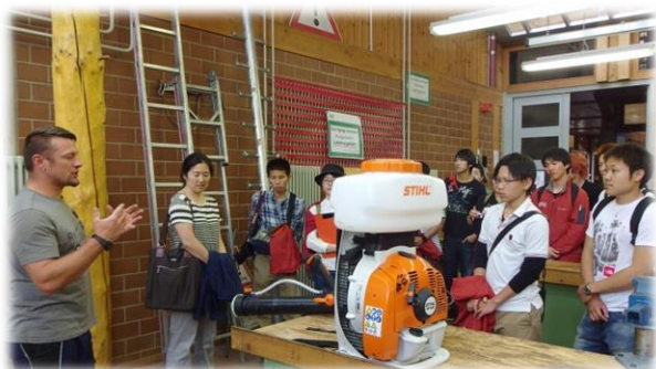
ドイツの林業大学校『マッテンホフ校』を訪問しました。3年生が卒業試験前の最終確認を行いました。