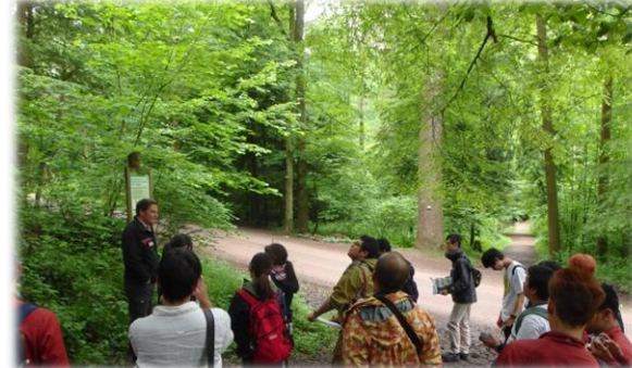
フライブルク市の市有林を管理するフォレスターの方から、市民の方が気軽に訪れる森林をどのように管理するか、レクチャーをいただきました。