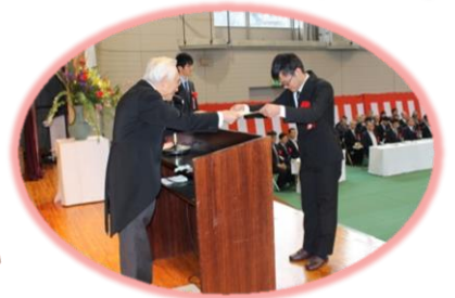
卒業証書を只木校長から

春を予感させる暖かな雨が降る中、3月8日林業大学校第5期生14名の卒業式が和知ふれあいセンターでとり行われました。