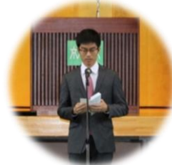
1年生から激励の送辞が

これからも皆様にお世話になることもあるかと思っておりますので、どうぞよろしくお願ひいたします。卒業生の各地での活躍を祈りたいと思います。