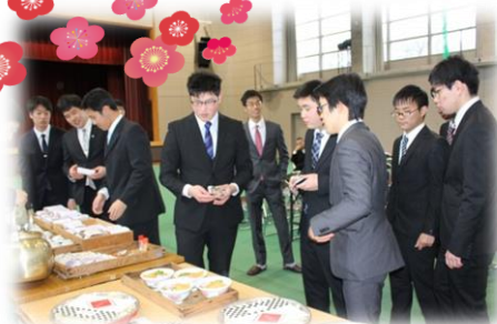
今年も地域の皆様ありがとうございました