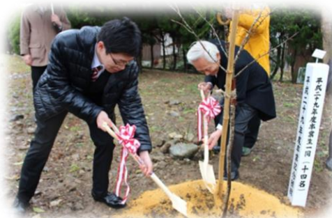
校長先生と一緒にヤマザクラを植樹