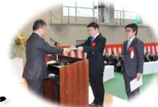
高性能林業機械操作士に 2人認定