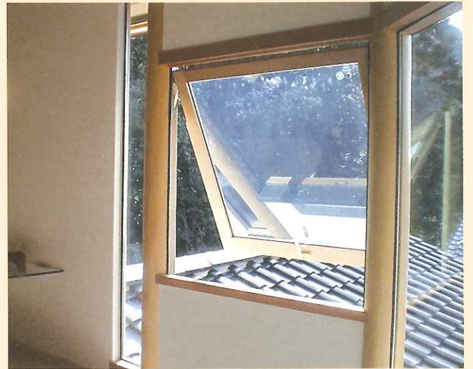
柱と窓枠に北山磨丸太を使用