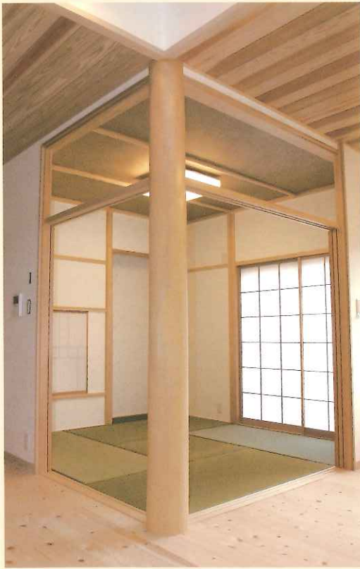
方立柱に北山磨丸太を使用