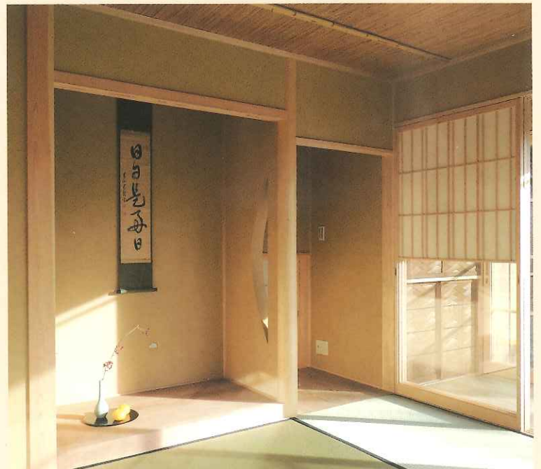
伝統的な床柱での利用