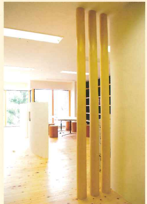
磨丸太を使ったオフィスリフォーム