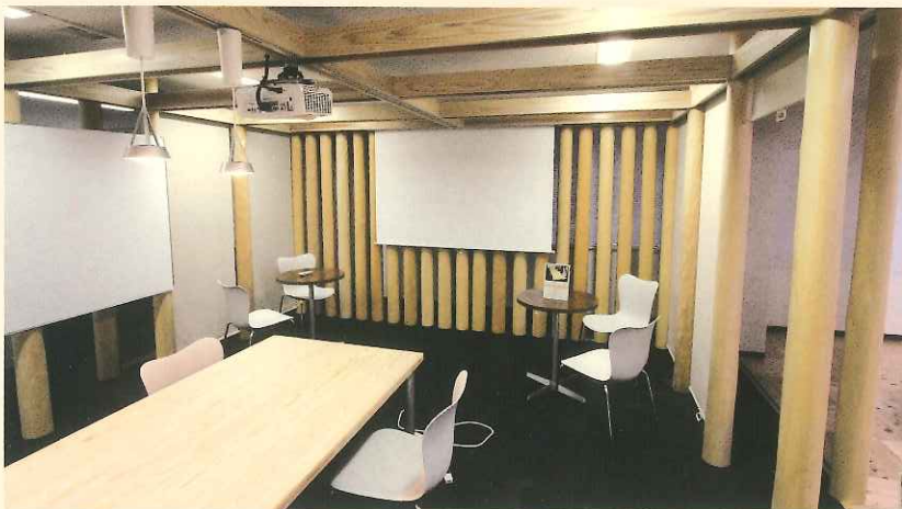
オフィスの会議スペースに北山磨丸太を利用 [株式会社ウエダ本社 協力]