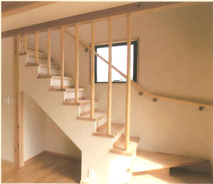
北山タルキを使用した階段