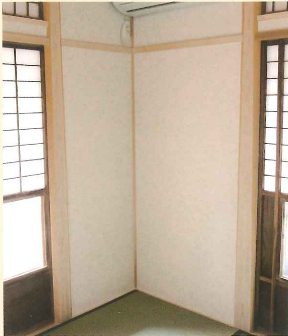
和室の柱に面皮柱を使用