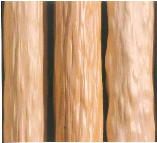
北山天然出絞丸太

木肌に自然にコブ状・波状の凹凸（絞り）ができたもので、品種や地質、日当たりによって様々な表情がみられます。