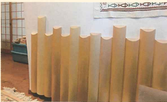
北山磨丸太を意匠的に利用