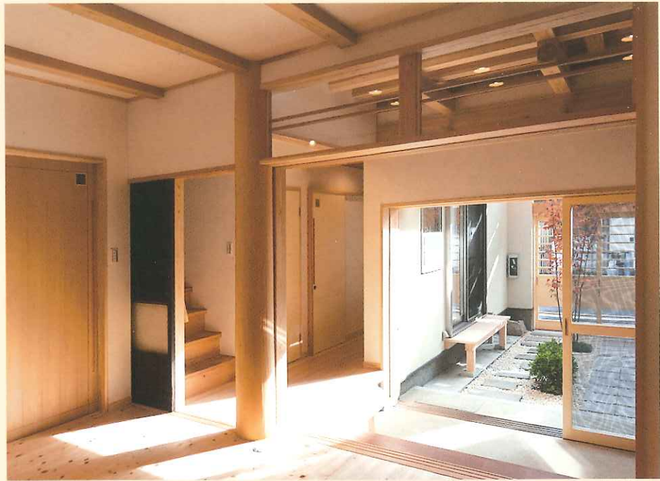
北山磨丸太を大黒柱として使用