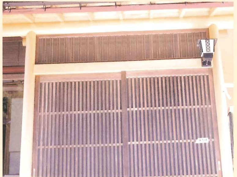
北山磨丸太を玄関に使用