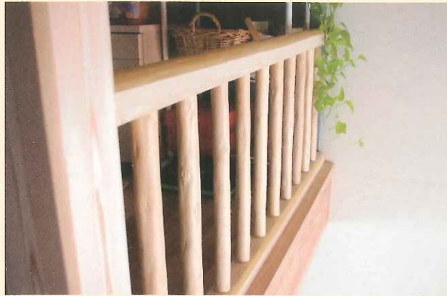
北山丸太(面皮柱、タルキ)を使用したロフト