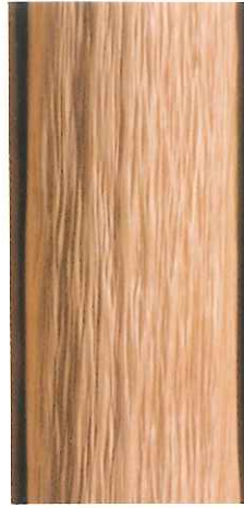
北山ちりめん絞丸太

木肌に自然にコブ状・波状の凹凸（絞り）ができたもので、品種や地質、日当たりによって様々な表情がみられます。