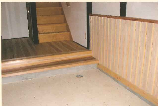
玄関の腰板に北山丸太(面皮付板)を使用