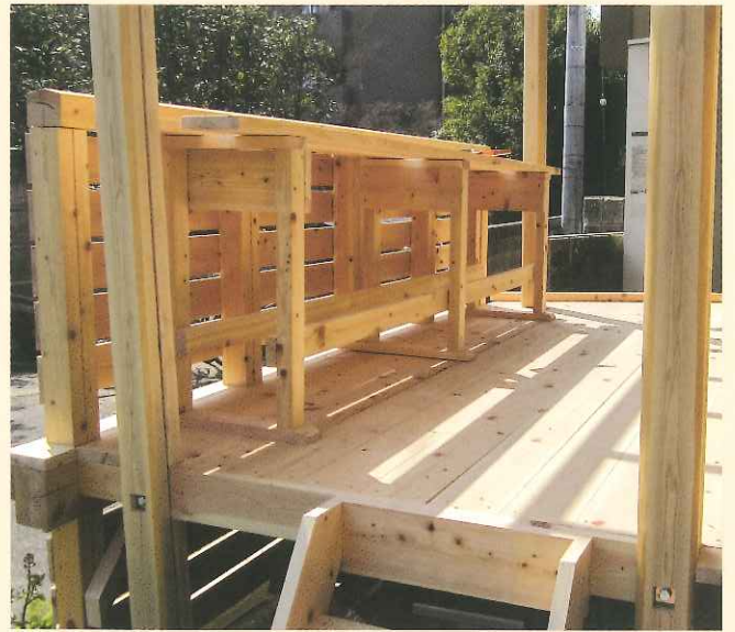
北山面皮柱をウッドデッキに使用