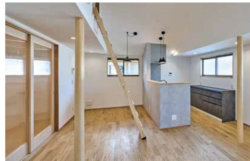
施工例 リビングダイニング