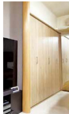
施工例 マンション