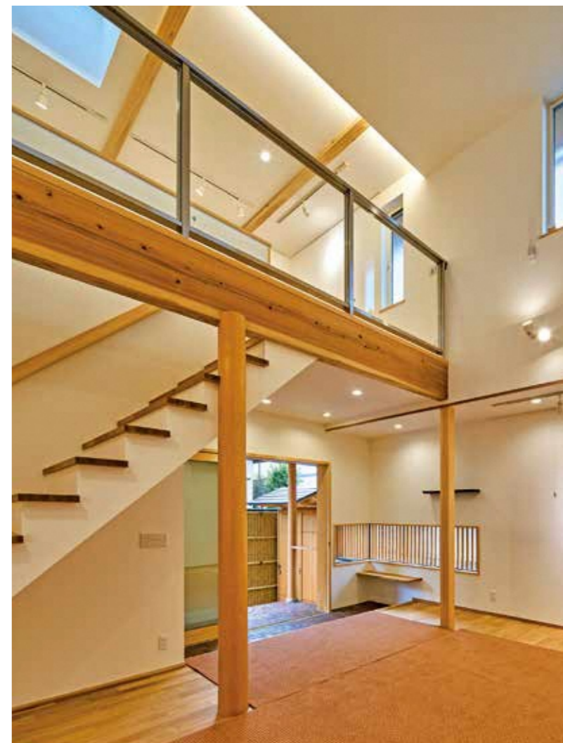
施工例 玄関ホール