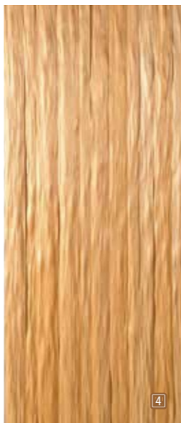
size : H1,800×W900×D25mm