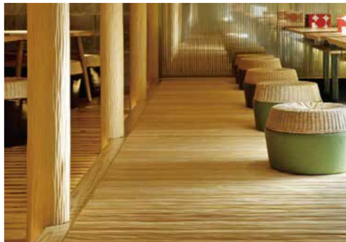
施工例 創作和食・居酒屋 (京都)