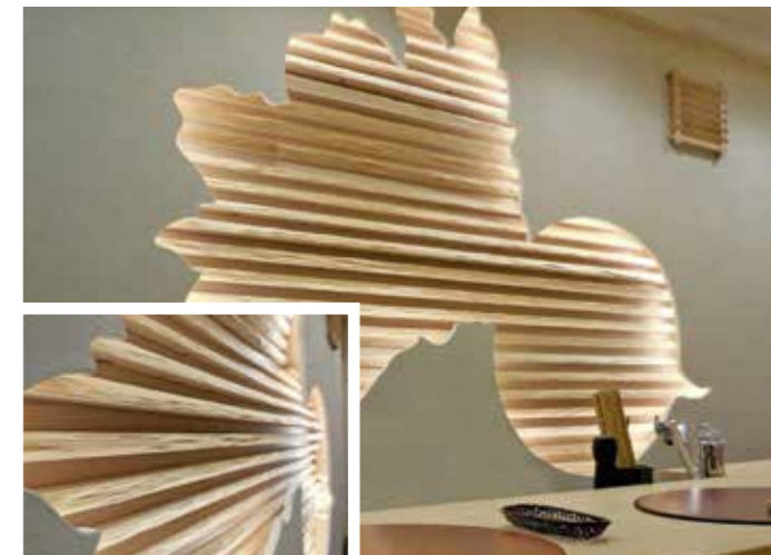
施工例 飲食店 (祇園)