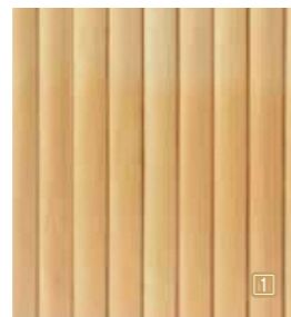
size : H900×W600×D30mm