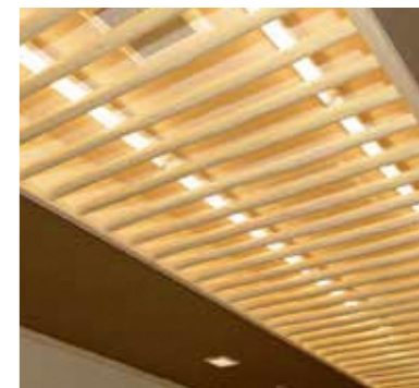
施工例 天井ルーバー