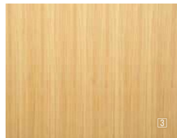
size : H1,800×W900×D6mm