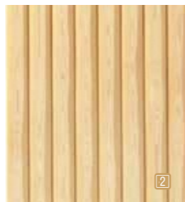
size : H900×W600×D30mm