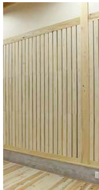
装飾壁材 施工例 事務所 (京都)

北山杉をスライスした板材を組み合わせた壁用パネルです。北山杉ならではの趣ある風合いを生かした、表情豊かな空間に仕上がります。