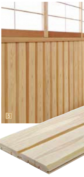
size : H910×W100×D20mm