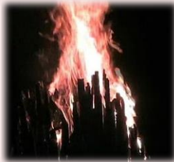
居籠祭り 西村寿美子 スケッチクラブ ミちやん