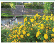
玉川の山吹 (井手町)