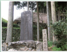
永谷宗円生家 (宇治田原町)