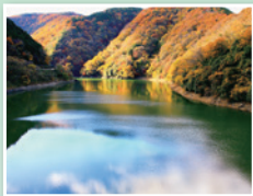
宇治川の紅葉 (宇治市)