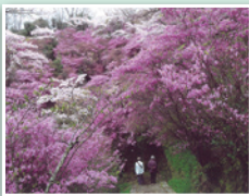
神童寺のみつばつつじ (木津川市)