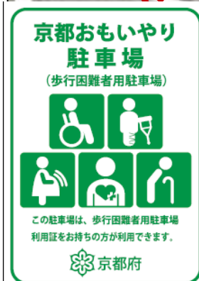
京都おもいやり駐車場 看板