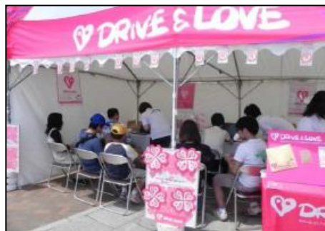
「DRIVE&LOVEプロジェクト」 (京都府:後援団体)