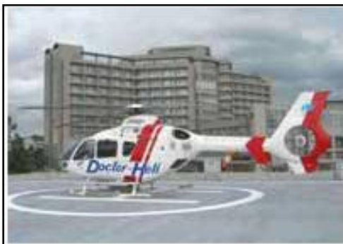
【ドクターヘリの離発着】 (高速道路内PA)