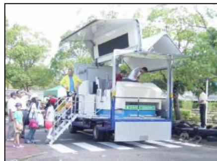
シートベルト効果体験