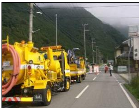
【災害時の復旧協力】