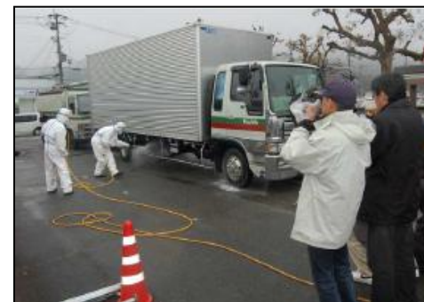
【京都舞鶴港との連携】