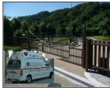
【緊急開口部の利用】