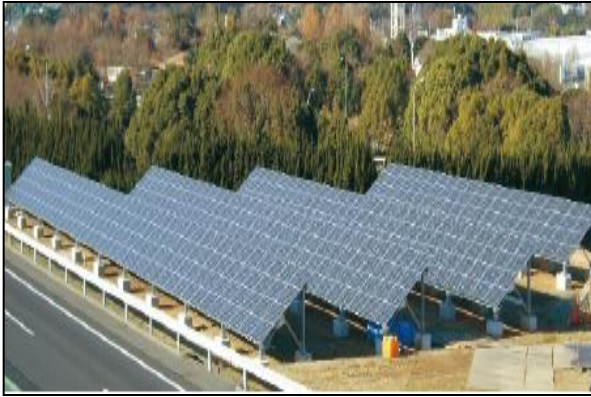
【 太陽光発電などの設置 】