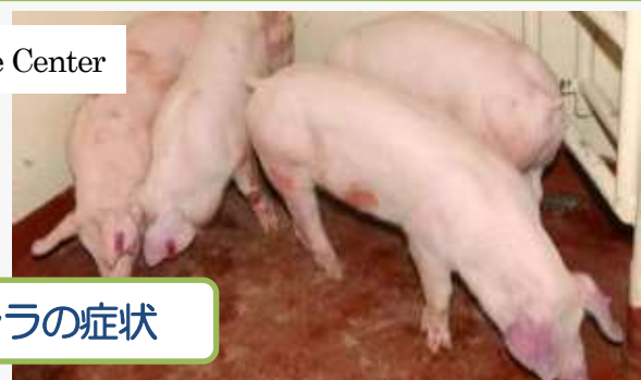
アフリカ豚コレラの症状

病状は多岐に渡り、甚急性、急性、亜急性、慢性の症状を示す。甚急性では突然死亡、急性では発熱 (40～42℃)、食欲不振、粘血便、チアノーゼ等を呈し、死亡率は100%に近い。