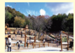
わくわくアスレチックパーク