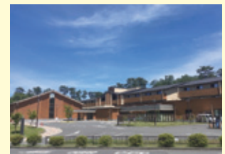
京都トレーニングセンター