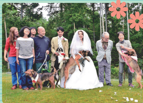
(参考:平成28年度の特選写真)