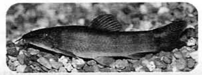
●アユモドキ(天然記念物)●

南丹地域の豊かな自然を守り、子ども達に引き継いでいくため、皆様のご協力をお願いします。