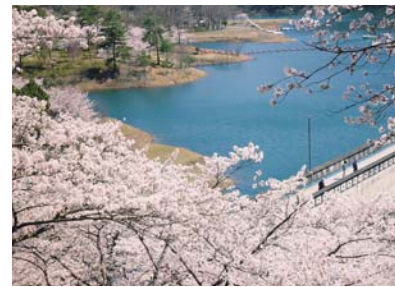
大野ダム (南丹市美山町)

自然豊かな京都丹波地方には、いたる処に春夏秋冬の花が咲き乱れます。特に桜の季節になると京都丹波一円に春の光を浴びて、ところ狭しと咲き誇る桜たちが幽玄の世界へと誘います。