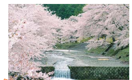
七谷川さくら公園 (亀岡市)