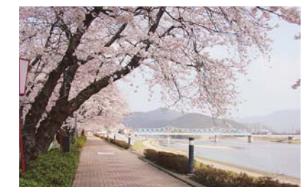
大堰川堤 (南丹市八木町)