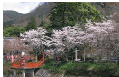
出雲大神宮 (亀岡市)