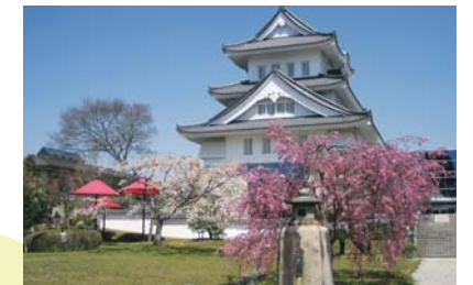
南丹市国際交流会館 (南丹市園部町)