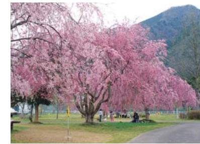
長谷運動公園 (南丹市美山町)