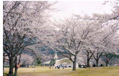
グリーンランドみずほ (京丹波町)