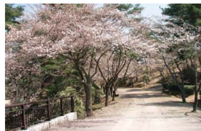
丹波自然運動公園 (京丹波町)