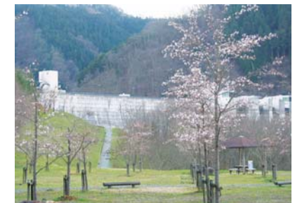
日吉ダム (南丹市日吉町)