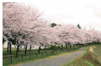
亀岡運動公園 (亀岡市)