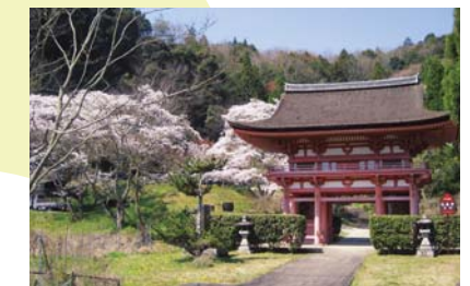
九品寺 (南丹市園部町)