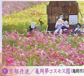
F 京都丹波/竜岡夢コスモ園 (亀岡市) 関西有数の規模を誇るコスモ園。約4.2haの面積に20品種約800万本のコスモスが風にそよぐ姿は圧巻。 京都縦貫自動車道 亀岡ICから約2分 JR亀岡駅観光案内所 ☎0771・22・0691