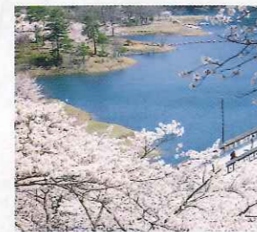
B 大野ダム (南丹市) 秋の紅葉に勝るとも劣らない、春の桜 京都縦貫自動車道 京丹波わちICから約20分 美山町観光協会 ☎0771・75・1906