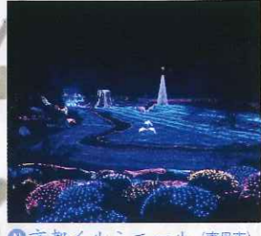
H 京都イルミネーション (南丹市) 関西最大級の光のイルミネーション。新たな京都丹波の冬の風物詩として人気。紅葉と同じ時期に楽しむこともできます。 京都縦貫自動車道 園部ICから約30分 園部町観光協会 ☎0771・65・5001