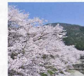
C 七谷川 (亀岡市) 春になると人々が集う安らぎのせせらぎ JR亀岡駅から亀岡市ふるさとバス川東コースで「七谷川」下車、徒歩約1分 JR亀岡駅観光案内所 ☎0771・22・0691