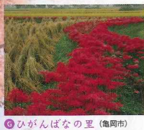
G ひがばなの里 (亀岡市) 彼岸花の名所。見ごろの時期になると畦に沿って咲く彼岸花を自当てに多くの写真愛好家が集まります。 京都縦貫自動車道 亀岡ICから約5分 JR亀岡駅観光案内所 ☎0771・22・0691