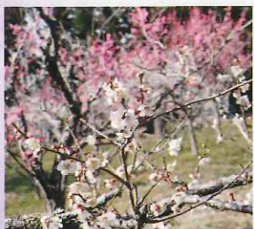
A 生身天満宮 (南丹市) 菅原道真ゆかりの生身天満宮の梅 京都縦貫自動車道 園部ICから約5分 生身天満宮 ☎0771・62・0535