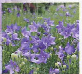
D ききょうの里 (亀岡市) 初夏には桔梗と紫陽花が咲き誇る「ききょうの里」。近くには明智光秀公ゆかりの谷性寺もあります。 京都縦貫自動車道 亀岡ICから約13分 JR亀岡駅観光案内所 ☎0771・22・0691