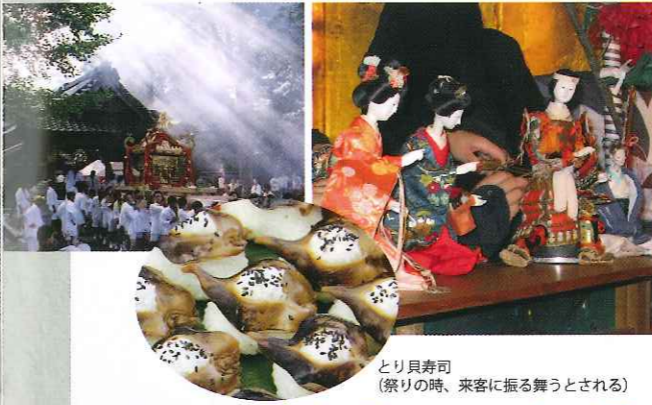
とり貝寿司（祭りの時、来客に振る舞うとされる）

亀岡市種田野町佐伯垣内赤一 京都縦貫自動車道 亀岡ICから約5分 問 種田野神社 0771-222-4549