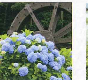
E 平の沢池 (亀岡市) 京都府内有数の探鳥地で府内唯一のオニバス自生地でもある平の沢池。「水鳥のみち」として親しまれています。 京都縦貫自動車道 千代川ICから約10分 JR亀岡駅観光案内所 ☎0771・22・0691