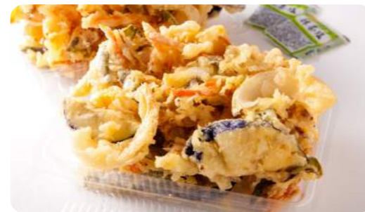
もり! もり! 野菜天ぷら 300円(税込)

玉ねぎやとうがらし、しめじなどその時々旬の野菜が盛りだくさん。 その日の朝市に並ぶ新鮮野菜をすぐにその場でかき揚げ天ぷら にしている。