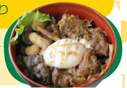
京丹波ぎゅう茸どんぶり 780円(税込)

大黒本しめじ、ハタケシメジ、しいたけ、丹波牛すじ肉の煮込みを黒 豆味噌で仕上げた丼。