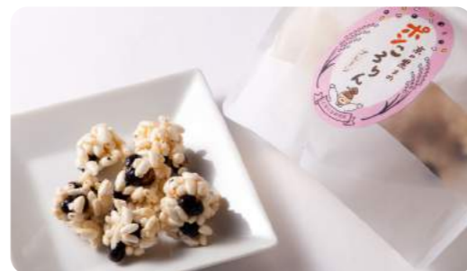
京の黒まめボンころりん 370円(税別)

「京都スタジアム」オープンに向けて開発した、一口サイズのボン菓 子。サッカーボールをイメージして丹波黒豆をちりばめました。