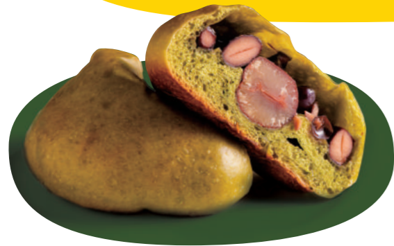
抹茶黒豆栗パン 280円(税別)

※P4～6のテイクアウト可能な商品の 税込表記は税率8%です。店内飲食の 場合は税込額が異なることがありま すので、店頭でご確認ください。