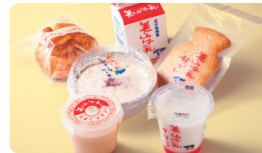
美山牛乳スイーツ

美山のきれいな空気と水、めぐまれた環境で飼育された乳牛による 「美山牛乳」の、濃厚な風味が豊かなスイーツの数々。