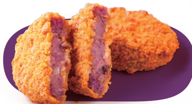
紫芋コロッケ 100円(税込)

お店で揚げたてをいただける、たっぷりの紫芋と亀岡牛だけを使っ たコロッケ。自然の甘みでおやつに最適。