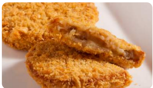
亀岡牛コロッケ 100円(税別)

1日500個売れたこともあるという、地元の人に愛されるコロッケ。 亀岡牛の肉の甘みとジャガイモの割合が絶妙。