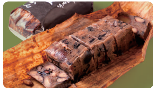
黒豆栗蒸ようかん 900円(税込)

丹波産黒大豆を練り込み、丹波くりを贅沢に使った蒸し羊羹。甘さ控 えめのもっちり食感で、上質な食材の風味を楽しめる。