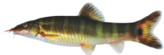
天然記念物 アユモドキ

今、身近な天然記念物「アユモドキ」を通じて、多くの方にふるさとの生き物たちに関心を寄せていただいています。アユモドキを縁に、いろいろな人とのつながりが生まれています。