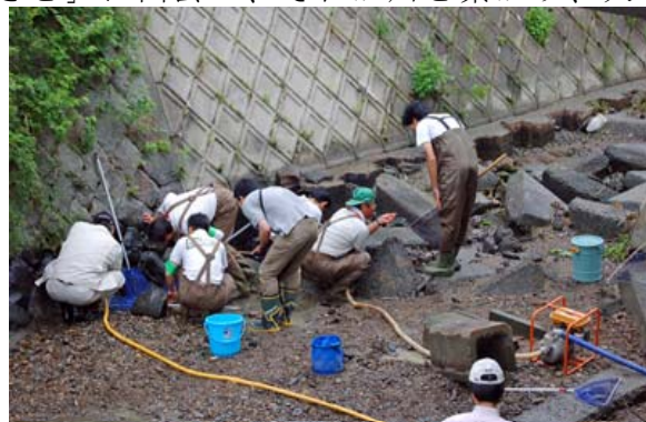
桂川支流での生息調査

これからは、美しい自然を大切にする「景観の時代」がやってくると思います。脈々と受け継がれて、今、息づいている目の前の豊かな自然環境を、次の世代に引き継いでいくために、このまちを「自然で語れる」まちにしたいと考えています。これからが大切です。あわてずにやっていきたいですね。