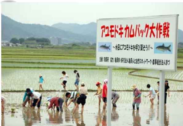
「アユモドキカムバック大作戦」

亀岡は、山並みも美しいですし、緑と水、田んぼも美しい。ですが、住んでいると、その美しさに案外気がつかない、当たり前の風景なんですね。失って初めて分かるのかもしれない。私たちは、ふるさとの自然を、もっと自慢したらいいじゃないかと思えます。そして、みなさんに自信を持って欲しい。そのために、自然の中に足を運んでいただいて自然を体感してほしいと思います。