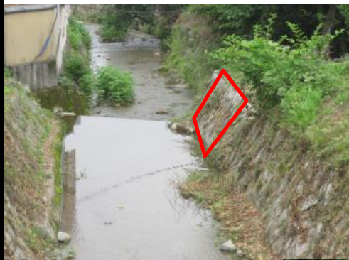
ショートカット部の取り付け下流端 取水堰を存置したこともあり法線に若干のズレ