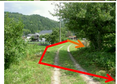
排水管の背後の状況