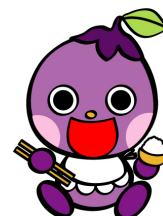
きょうと食育ネットワーク マスコット「なす坊」