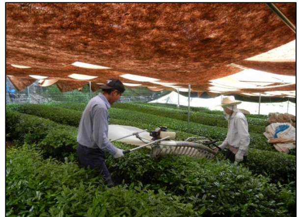
摘採(てきさい)と呼ばれる茶の収穫の風景

遮光資材で被覆。光を遮ることで、露天で栽培される煎茶にはない、鮮緑色と独特の芳香やまろやかな旨味や甘味のある茶に。