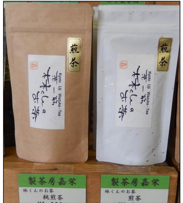
「林くんのお茶」として販売