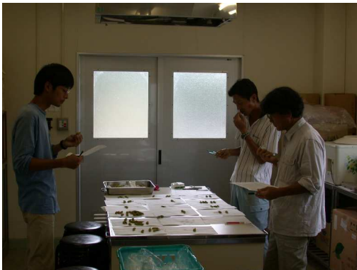
食味官能試験の様子（8月12日）