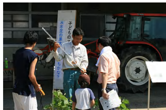
子どものスタンプラリー