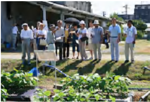
施設・ほ場見学ツアー

当日の参加者は505名と酷暑のためか昨年に比べ人出は少なかったものの、研究所全体が活気あふれた一日となりました。