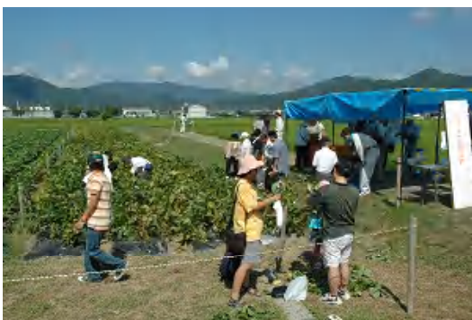
エダマメの収穫体験