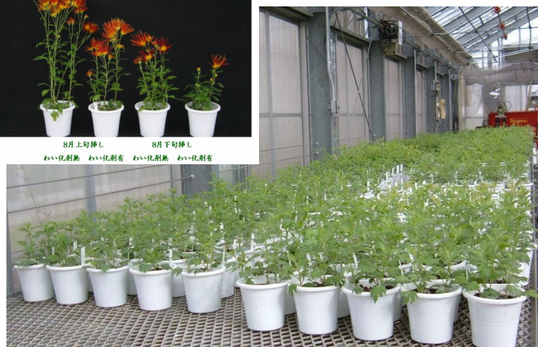
ガラスハウス内で栽培試験中の嵯峨ギク