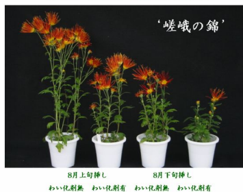
園芸学会近畿支部会での報告 (一部抜粋)