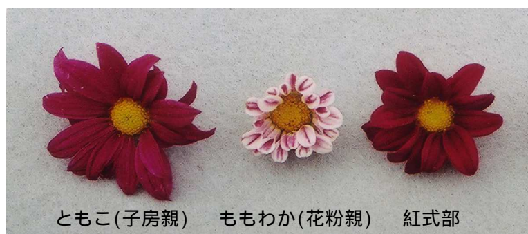
ともこ(子房親) ももわか(花粉親) 紅式部 交雑親および育成個体の花冠