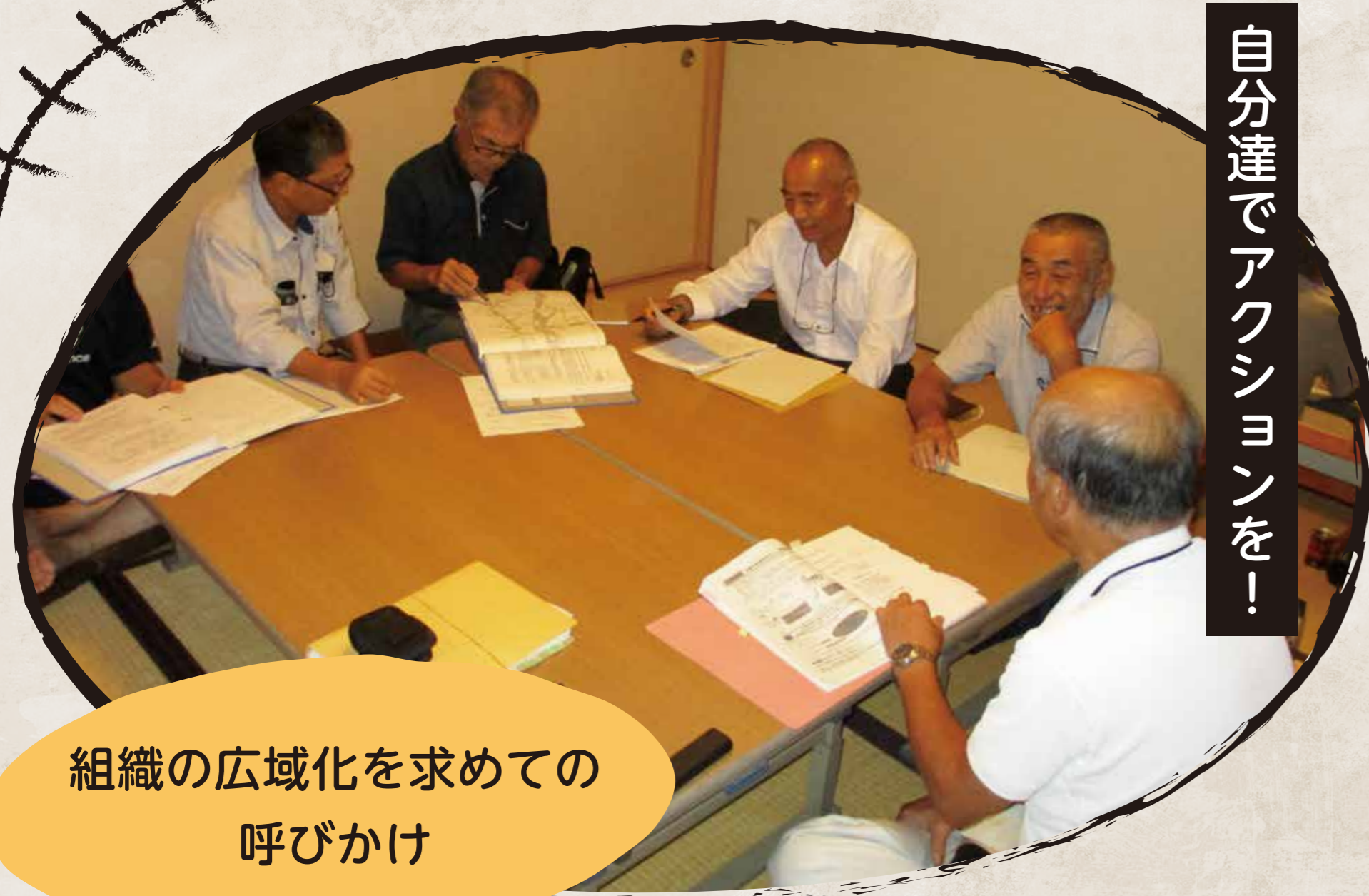
自分達でアクションを！