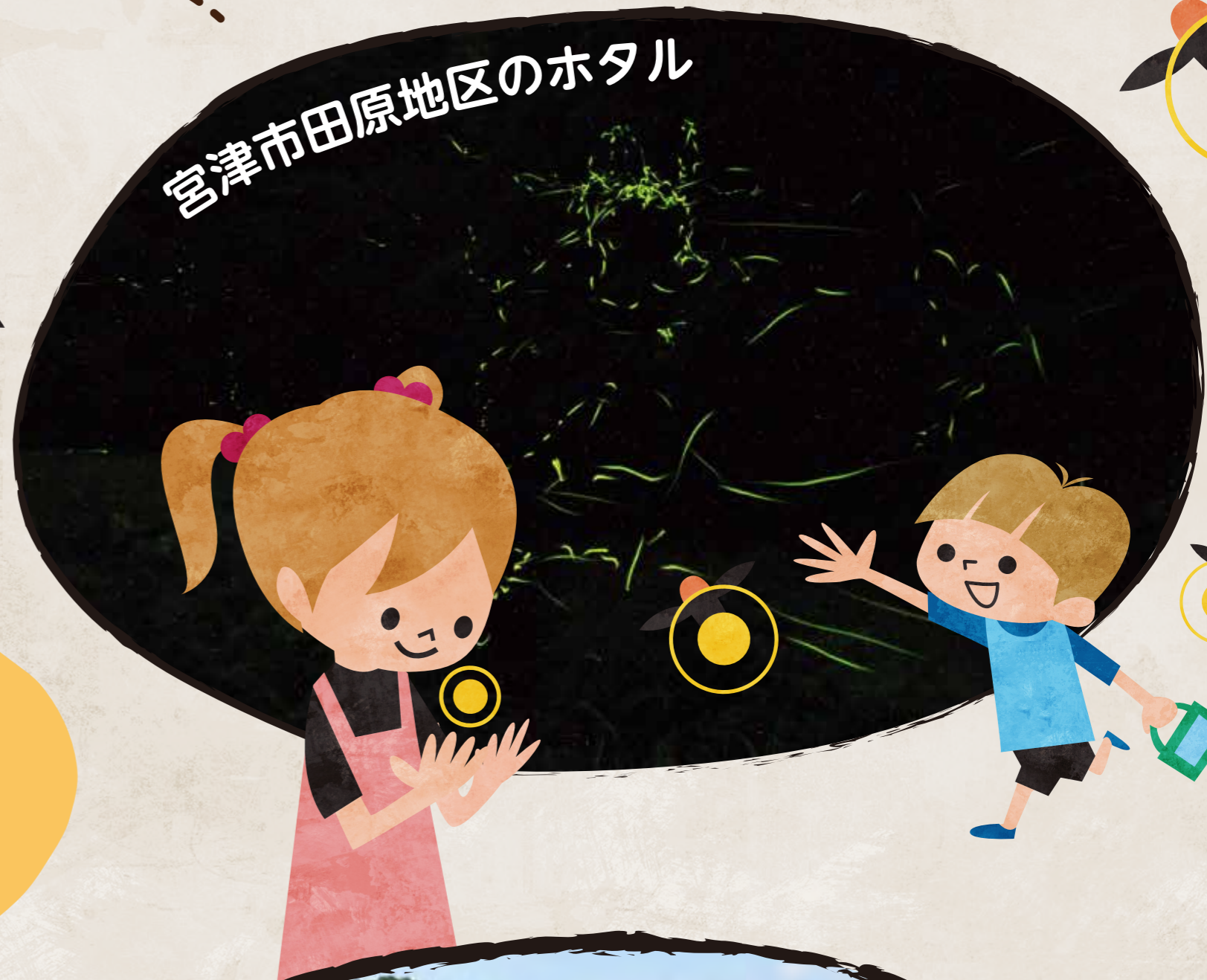
宮津市田原地区のホテル