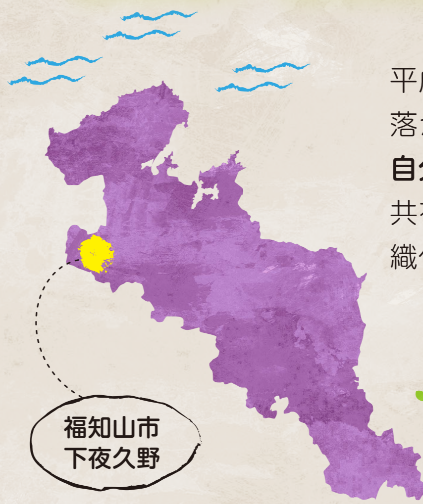
福知山市 下夜久野

平成の合併で福知山市の一部となった旧夜久野町内では、集落が消滅していることを目の当たりにして危機感を募らせ、自分達で自分達の地域を守らなければならないと思う意識を共有し、旧村単位である下夜久野を1つの単位とする広域組織化を図っています。