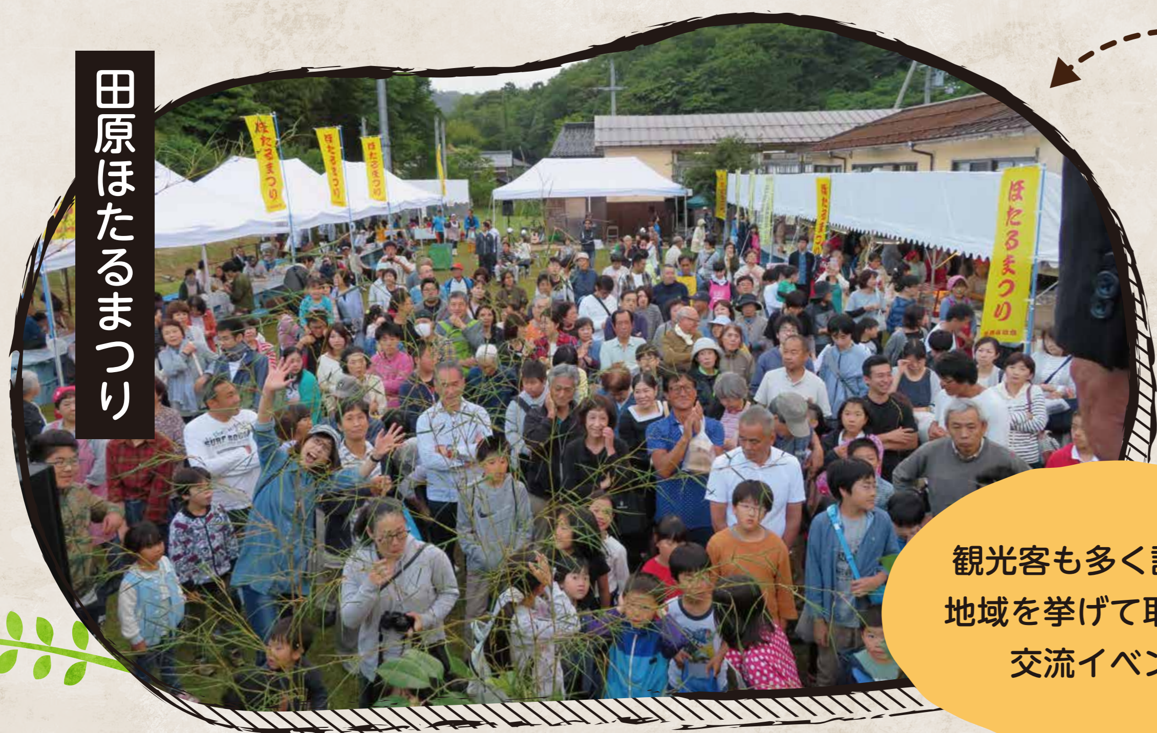
田原ほたるまつり