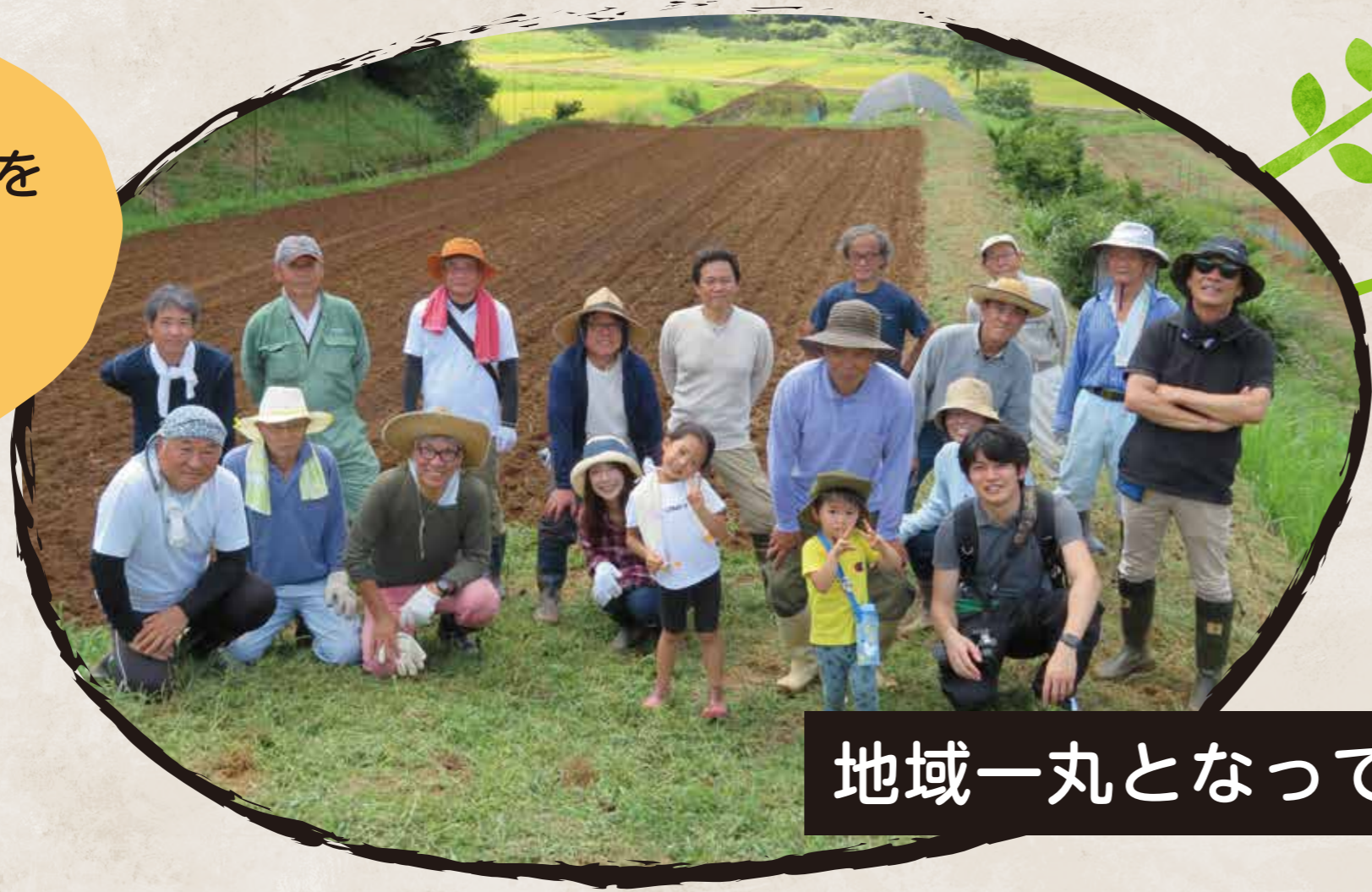
地域一丸となって