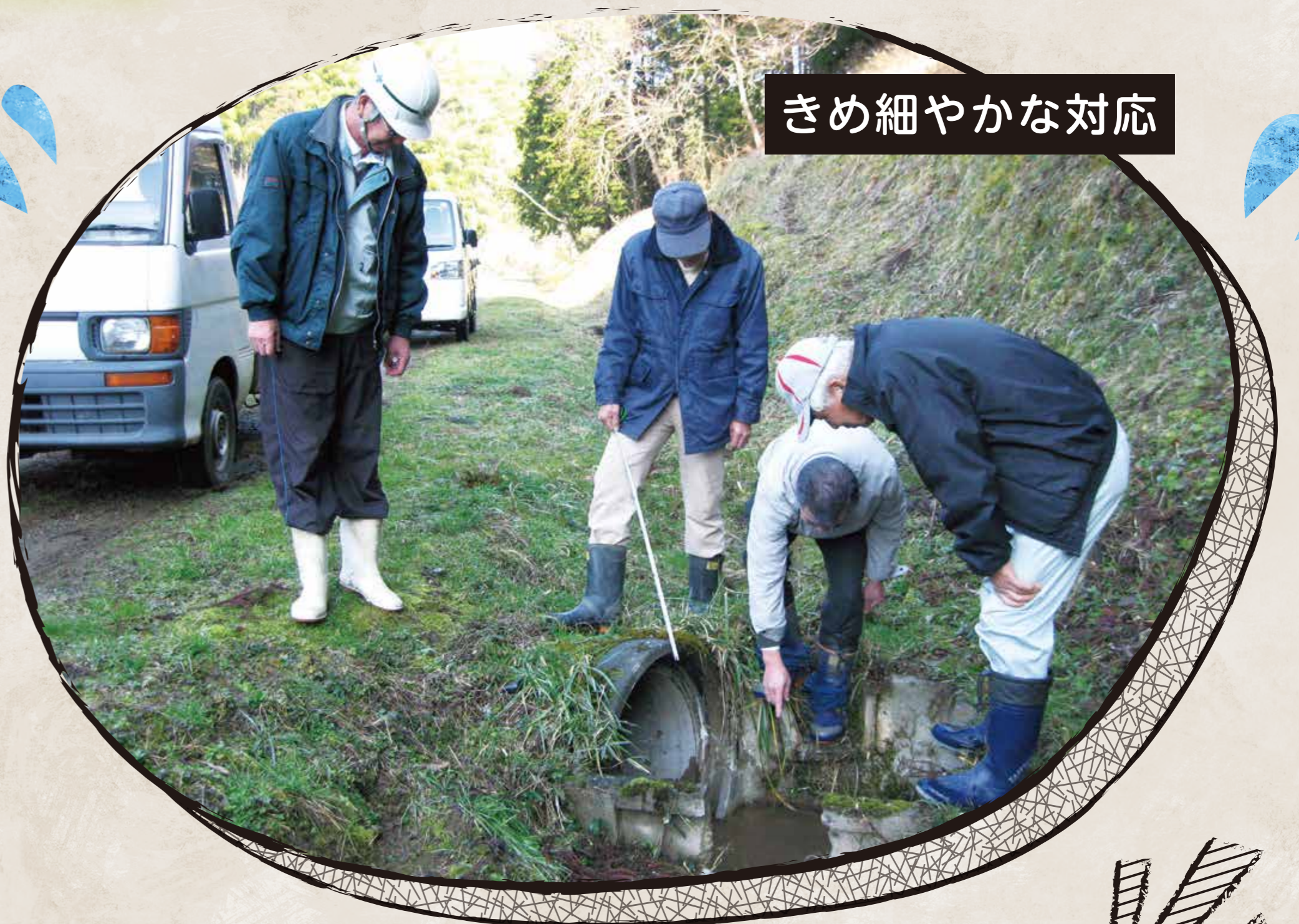
きめ細やかな対応