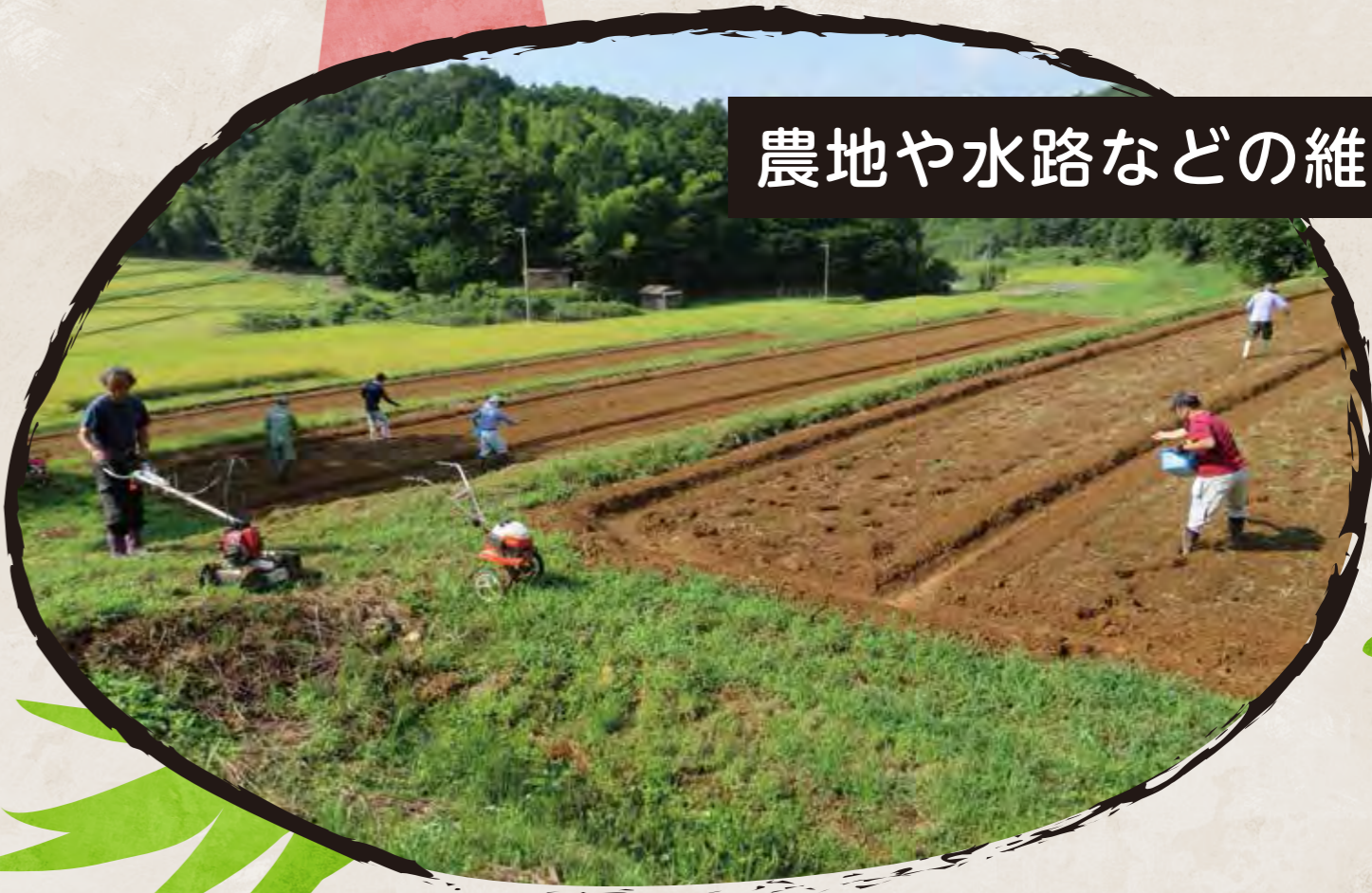
農地や水路などの維持管理