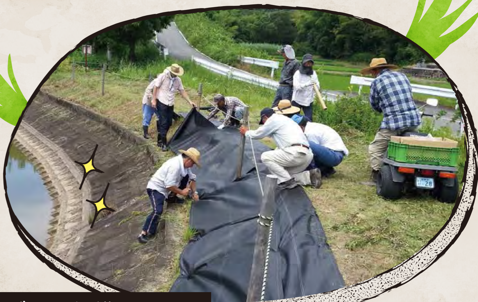
さまざまな組織とともに 一体的な地域づくり