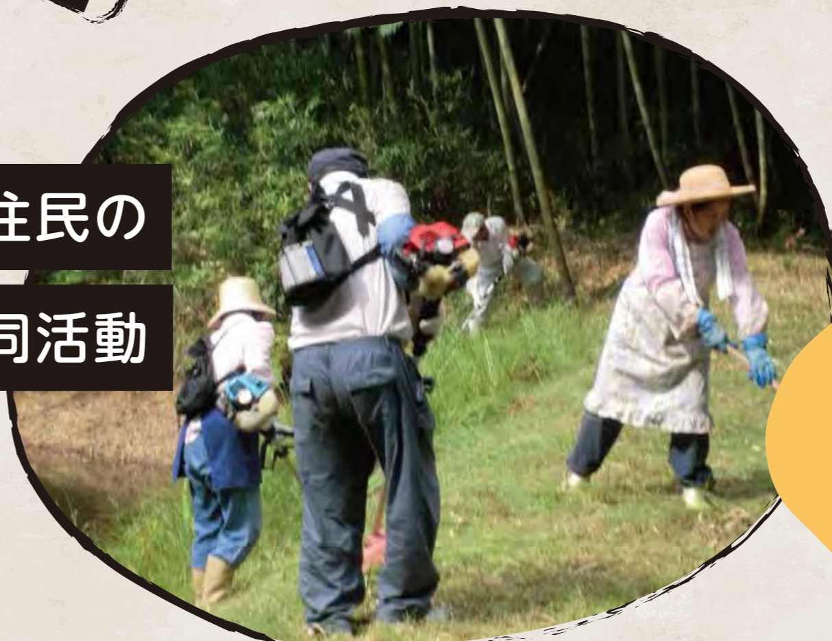
地域住民の 共同活動