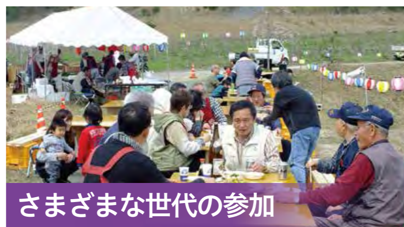
さまざまな世代の参加