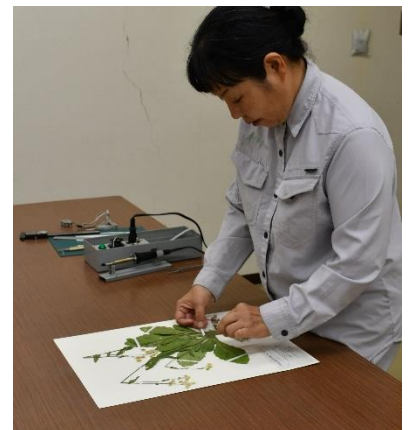
植物標本の貼付作業