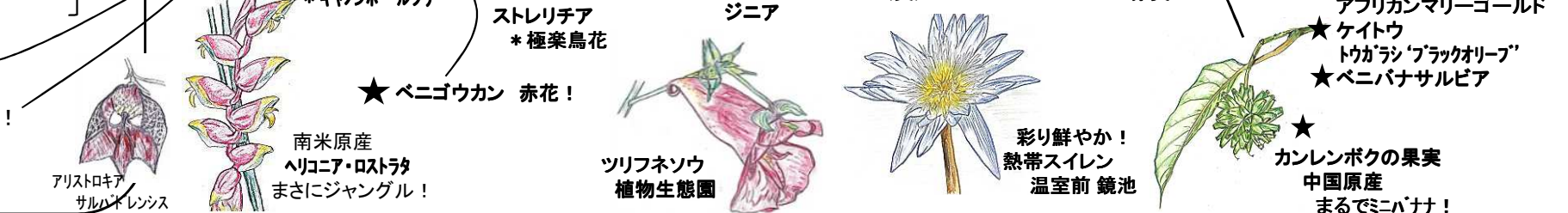
アリストロキア サルパドレンシス