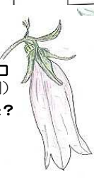
ホタルブクロ (植物生態園) *火垂が由来?