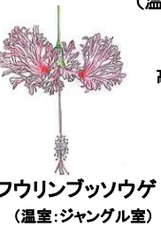
フウリンブッソウゲ (温室:ジャングル室)