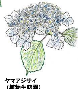
ヤマアジサイ (植物生態園)