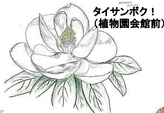
タイサンボク! (植物園会館前)