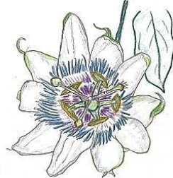
トケイソウ (ワイルドガーデン 四季彩の丘)