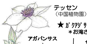
テッセン (中国植物園) ★ガクザサイ 'オクサ' *お滝さん!