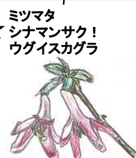
★ミツマタ シナマンサク! ウグイスカグラ