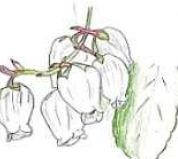
アセビ (植物生態園 他)