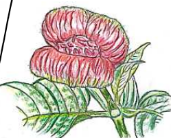
ホット・リップス (温室:ラン室)