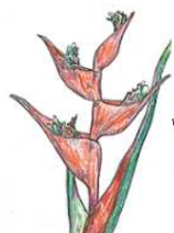
ヘリコニア・ストリクタ (温室:ジャングル室)