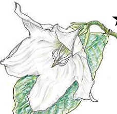
ホーモンティア・ムルティフロラ! *雄しべ雌しべを観察!(温室)