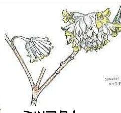
ミツマタ! *咲いてきました!