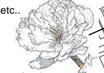
コブクザクラ! *雌しべ何本ある?