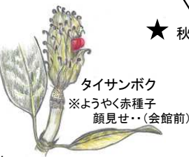
★タイサンボク ※ようやく赤種子 顔見せ..(会館前)