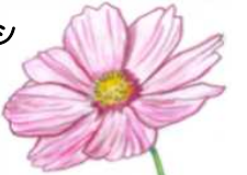
★コスモス!! (バラ園東花壇ほか)

★ガーベラ、ジニア ★コスモス、ケイトウ ★カンナ、フレンチマリーゴールド ★ノゲイトウ、トウガラシ ★キバナコスモス