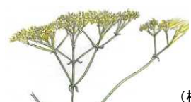
ユキヒバナ スズムシバナ (植物生態園)