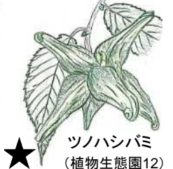
★ ツノハシバミ (植物生態園12) * 日本のヘーゼルナッツ!