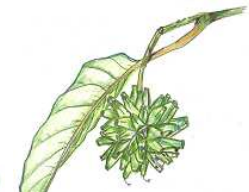
★ カンレンボク * ユニークな果実! (あじさい園南東)