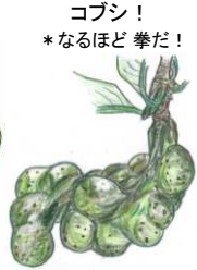
★ コブシ! * なるほど 拳だ!