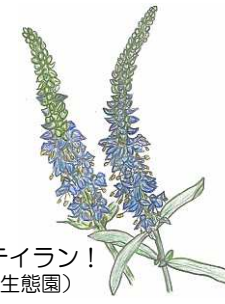
トウテイラン! (植物生態園)