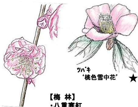
ツバキ '桃色雪中花'