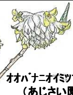
オオハナオイヅマタ (あじさい園)