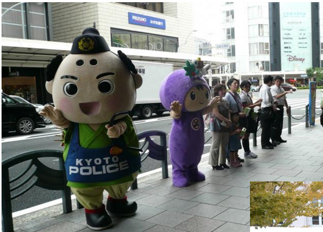
H30.6.23 ヤング街頭キャンペーン