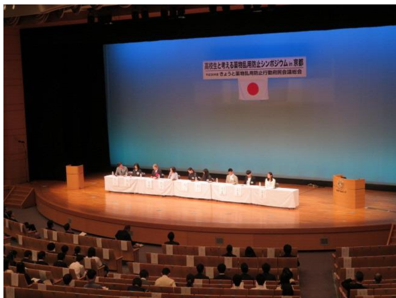
平成30年11月11日 府民会議総会開催(京都外大)

PTA、青少年団体、業界団体など、150以上の団体から構成し、 オール京都による薬物乱用未然防止対策 を推進