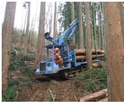
フォワーダによる運搬状況