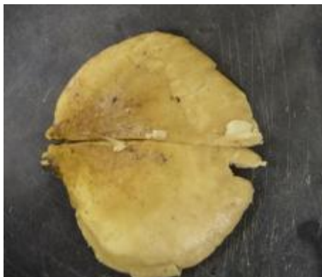
図鑑より色が薄い場合があります。