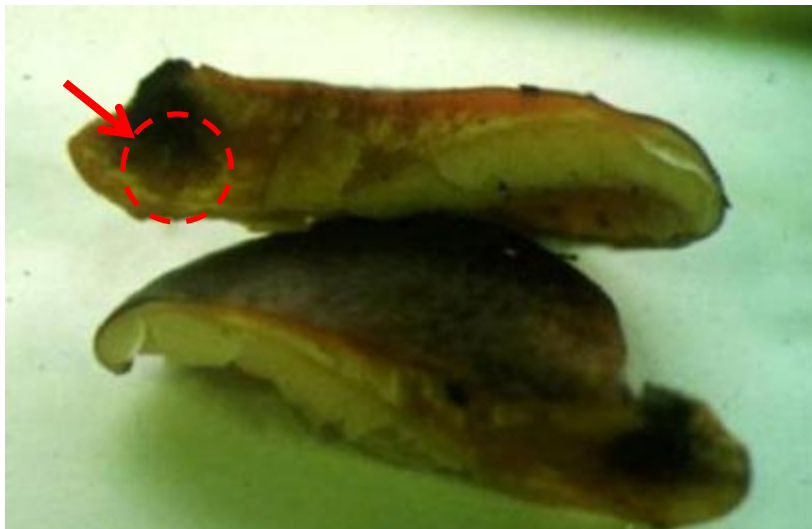
ツキヨタケ 色はシイタケ、形はヒラタケに似ていますが、断面を見ると、軸の付け根の肉に黒いシミがあります。

皆さんも自然に生えているキノコを食べるときは、よく知っているキノコだと思っても、「似た毒キノコかもしれない」と疑って、少しでもおかしいと思う点があれば、決して食べないようにしてください。