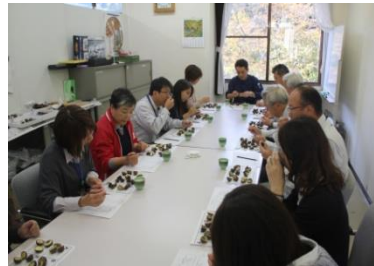
氷蔵クリの食味調査