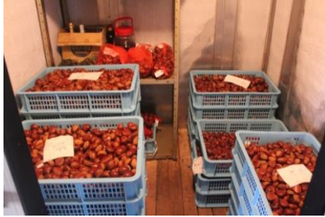
氷蔵庫でのクリの大量貯蔵