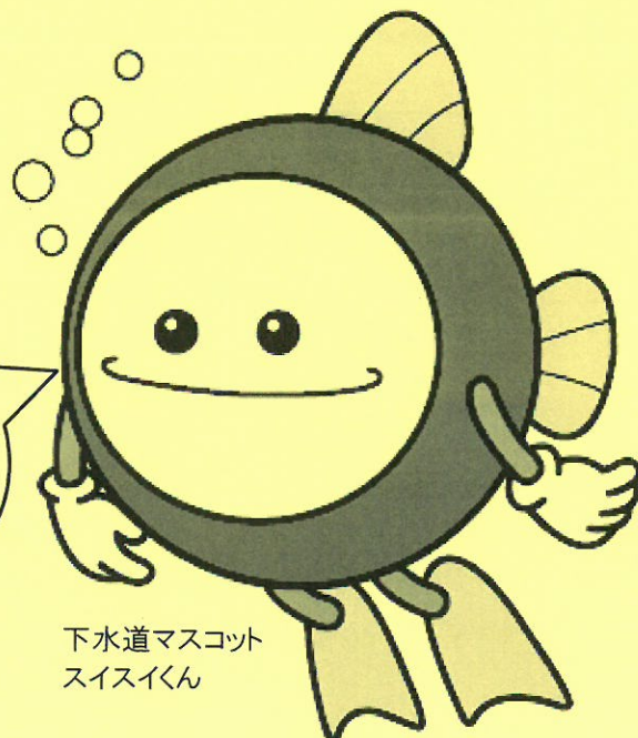
下水道マスコット スイスイくん