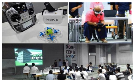
ドローンレースやゲームジャムの開催