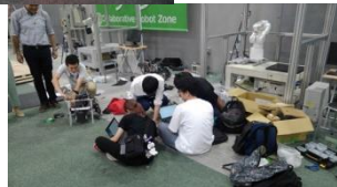
ロボコン出場に向けた練習