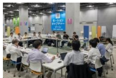
各種勉強会の開催