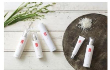
玉理化学(株)「伏水薫(Fumika)」 伏見の水や京野菜エキスなど を使用した基礎化粧品。