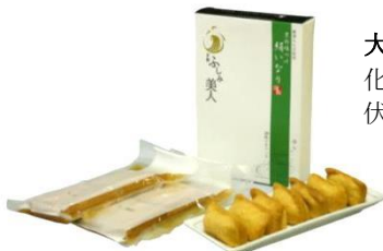
大京食品(株)「京の味つけ絹いなり」 化学調味料無添加、かつおと真昆布のだし、 伏見の酒粕を用いたおあげ。