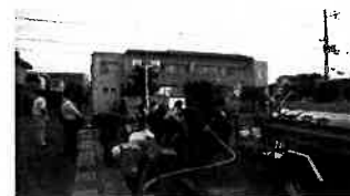
平成30年6月18日大山崎町での状況