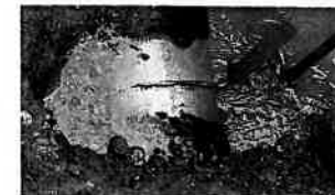
平成30年1月27日福知山市配水管断水事故