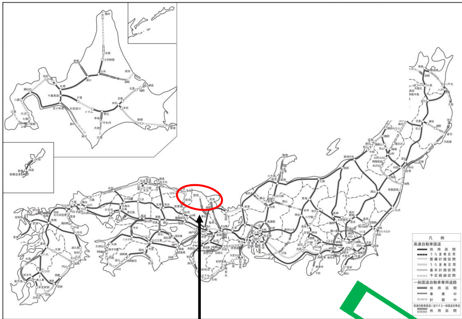
高規格幹線道路網図