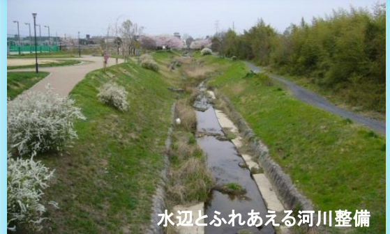
水辺とふれあえる河川整備