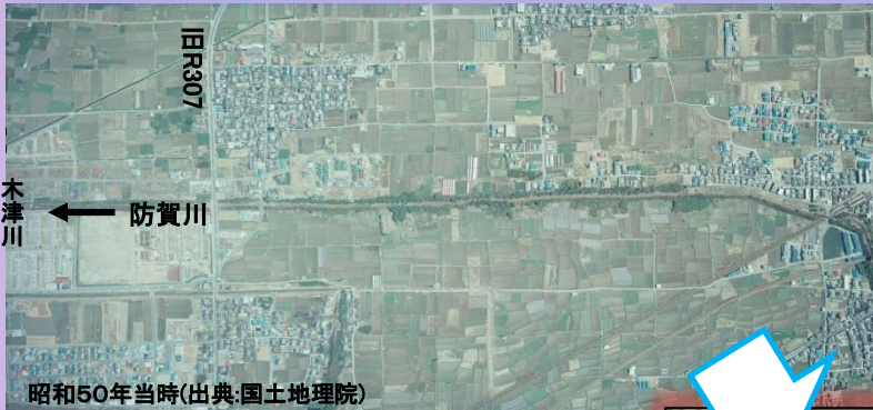
昭和50年当時