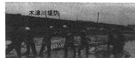
漏水箇所における地元消防団等による釜段工実施状況