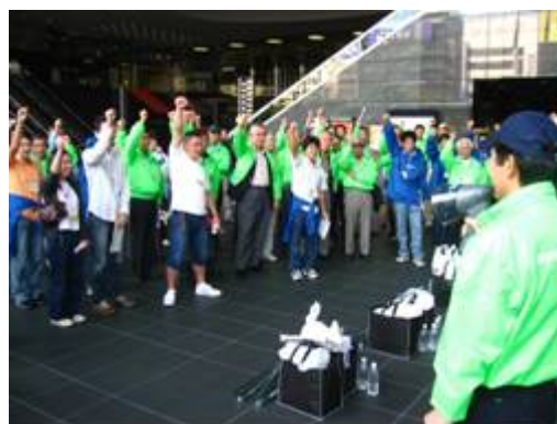
10月4日： 京都駅周辺、京都南ロータリークラブと