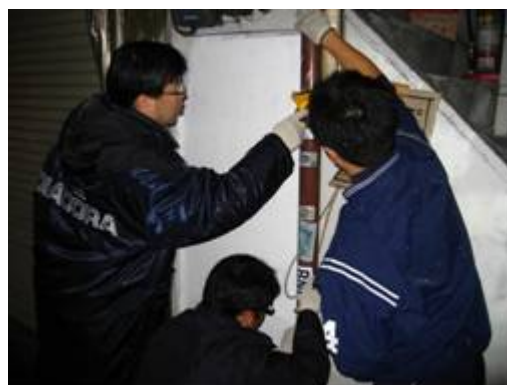
11月25日：錦市場商店街、知事初参加