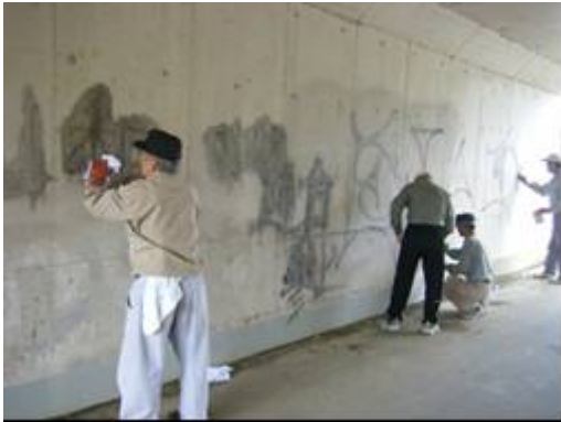
舞鶴市堂奥地内での作業風景