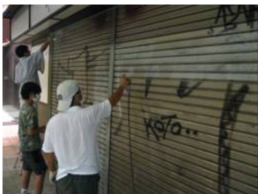
8月1日（第1回）： 寺町京極商店街

「職員通信」や「庁内掲示板」を活用して、全ての府職員へボランティア参加を呼びかけています。このことは、広報や一緒に説明に行くといった事業面での「協働」から一歩進んで、府職員のボランティア活動に対する参画意欲の向上の喚起につながっています。