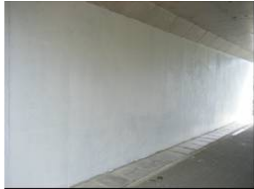
こんなにきれいになりました。

職員ボランティアも毎回新たな参加者を迎え、平成20年度は計10回、延べ474人、うち府職員参加者168人の参加となりました。特に、府職員は、本庁だけでなく、府立大学や府立病院を含む各公所から参加があり、ボランティア意識の高い職員が随所におられることを心強く感じています。