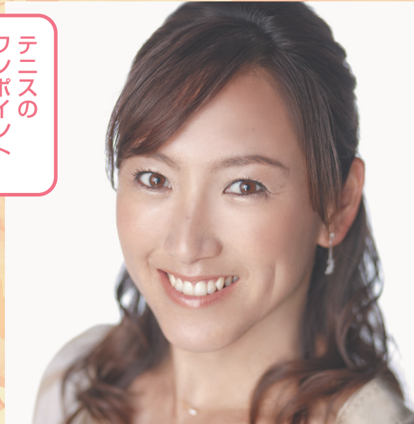
プロテニスプレーヤー 杉山 愛トークショー

京都ヒューマンフェスタ2010参加企画 シンポジウム・パネル展示等 「『韓国併合100年』と 在日韓国・朝鮮人」