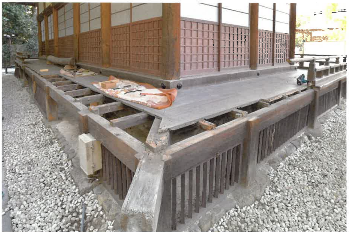
細殿 縁高欄解体の状況