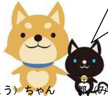
京(きょう)ちゃん 黒(みやこ)ちゃん 「動物愛ランド・京都」マスコットキャラクター

今年は 杉本 彩さん(女優・タレント)と IMALUさん(歌手・タレント)も 参加されます!!