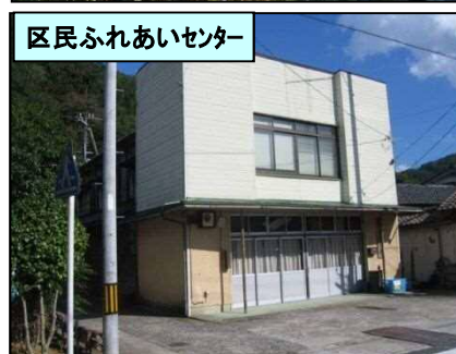
区民ふれあいセンター